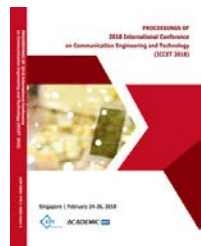
2018 | 新加坡 EI核心&Scopus