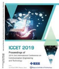
2019 | 名古屋 EI核心&Scopus